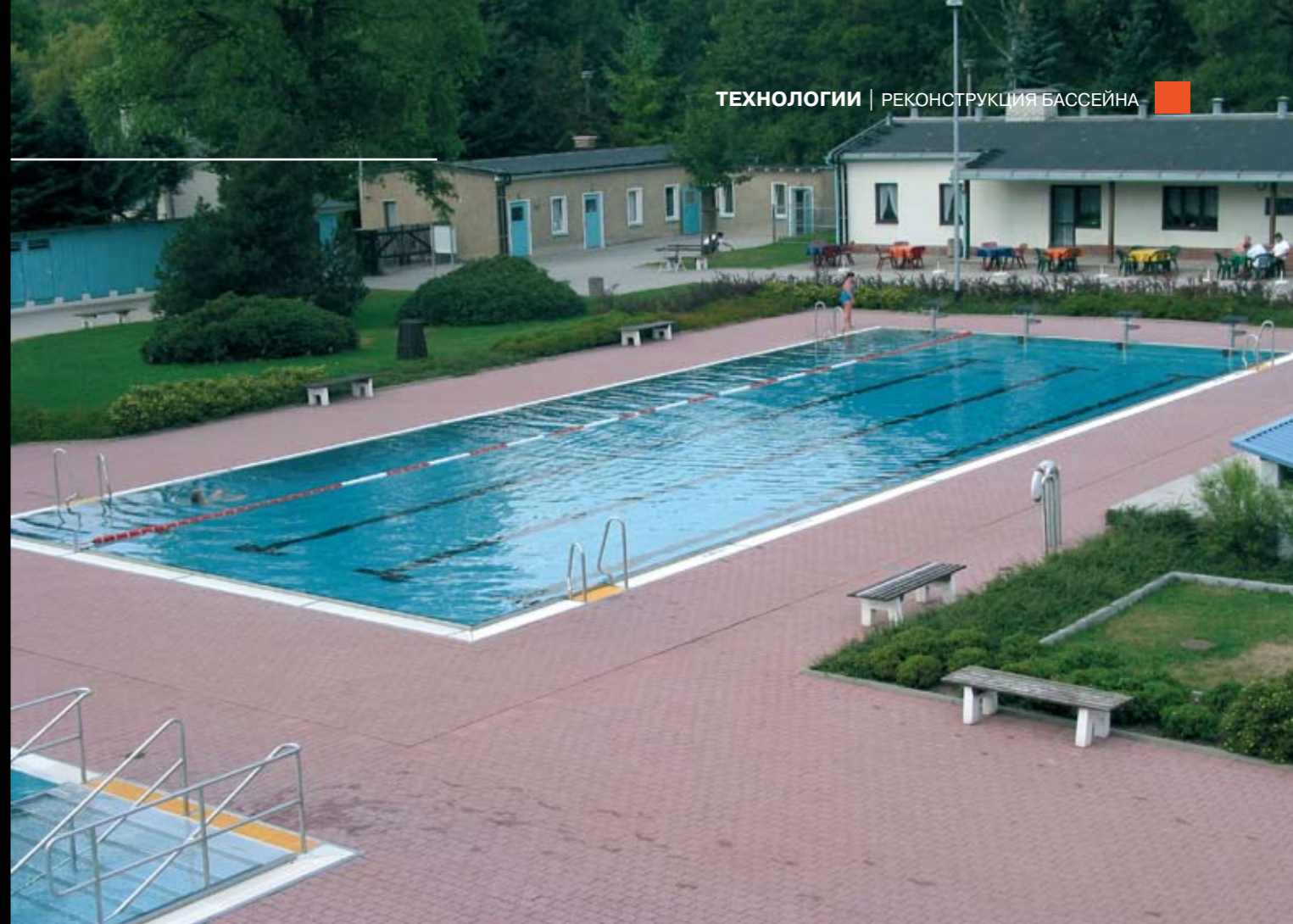
На фото: ↑ После установки и сваривания стенок и переливных лотков бассейна может производиться укладка плиток и плит на обходной дорожке

После комплектования бассейна аттракционами, поручнями и т.п., сварные швы подвергаются травлению, пассивации, и бассейн подвергается общей чистке. Сразу же после этого бассейн должен быть наполнен водой, так как при прямой инсоляции металлические листы в основании бассейна могут быть покороблены (искривлены).