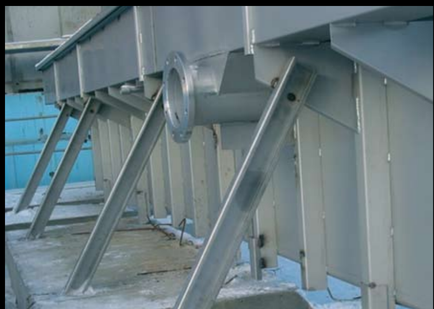
На фото: ↑ Стенки бассейна укреплены свободными опорами

Стены чаши бассейна, облицованные нержавеющей сталью, должны надежно выдержать все нагрузки, возникающие при наполнении бассейна